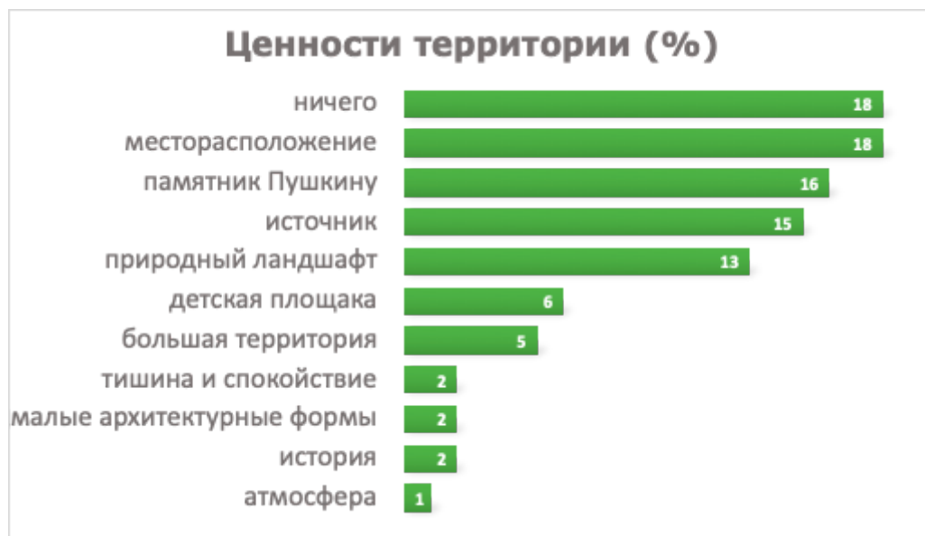
Рисунок 1. Ценности территории

Следует также отметить, что существенная часть опрошенных (18%) посчитала отсутствие в парке на текущий момент каких-либо ценностей.