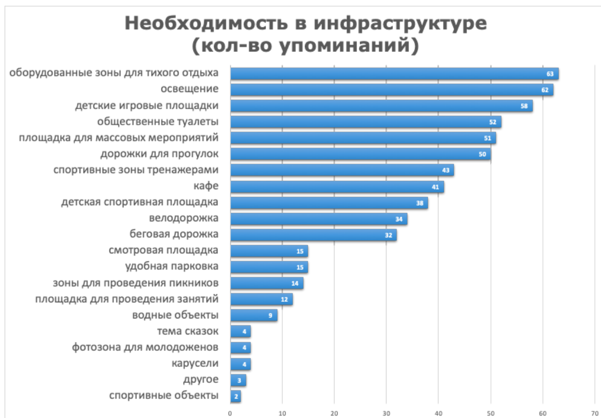
Рисунок 3. Инфраструктурные объекты

нанесении четверостиший из произведений Пушкина на таблички, наполнение парка малыми архитектурными формами в виде сказочных персонажей или проведением квестов по сказкам Пушкина в парке.